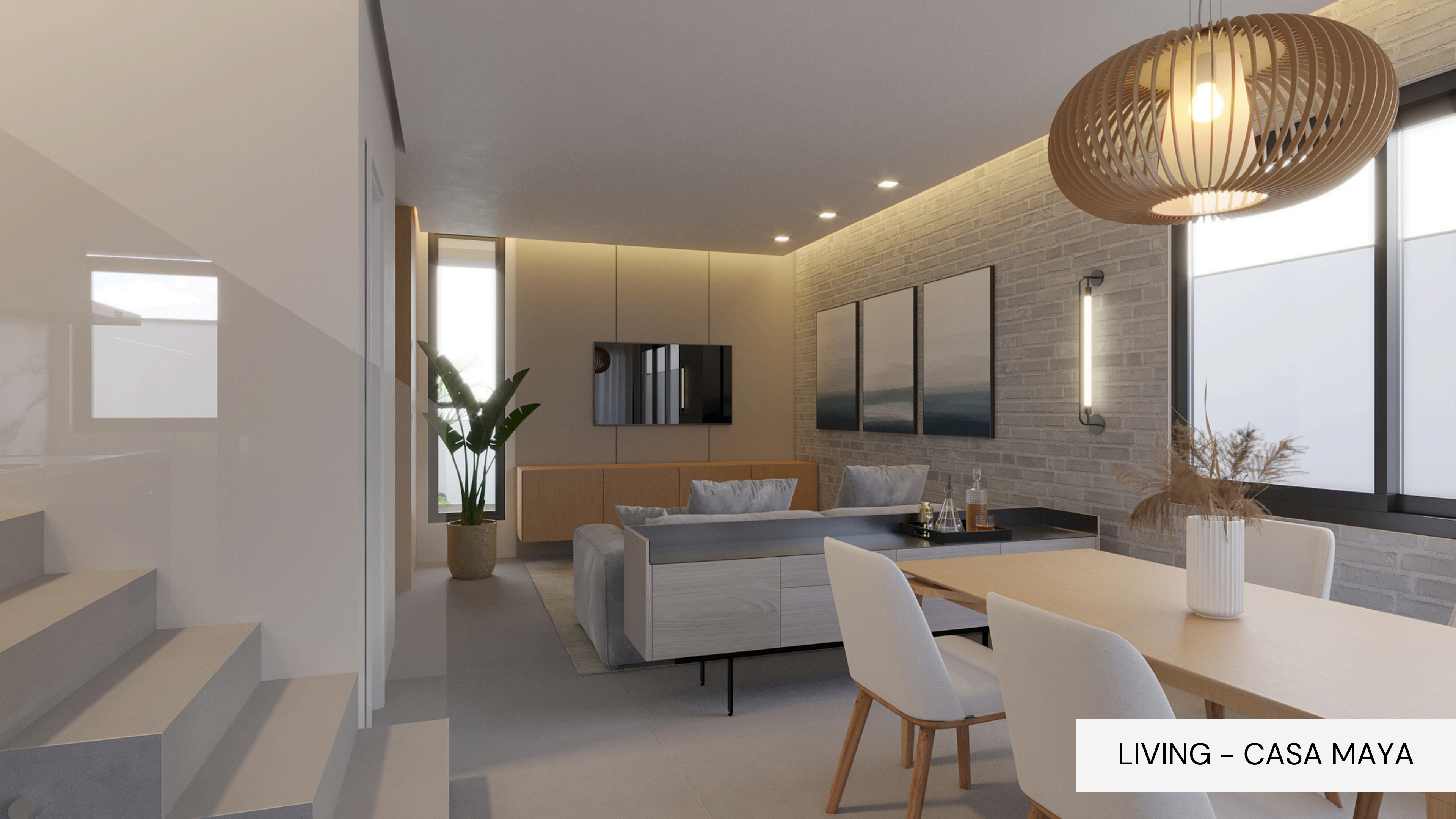
LIVING - CASA MAYA